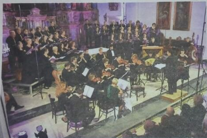
VARAŽDINSKE BAROKNE VEČERI

Ovacije najvećem ovogodišnjem projektu domaćih snaga